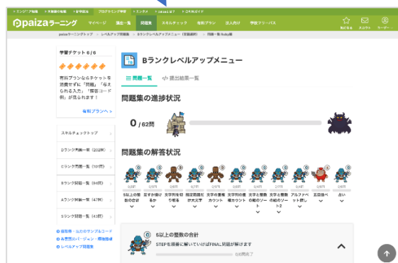
レベルアップ問題集