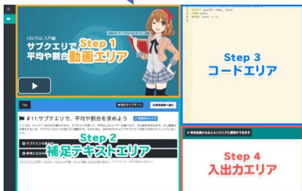
学習画面イメージ